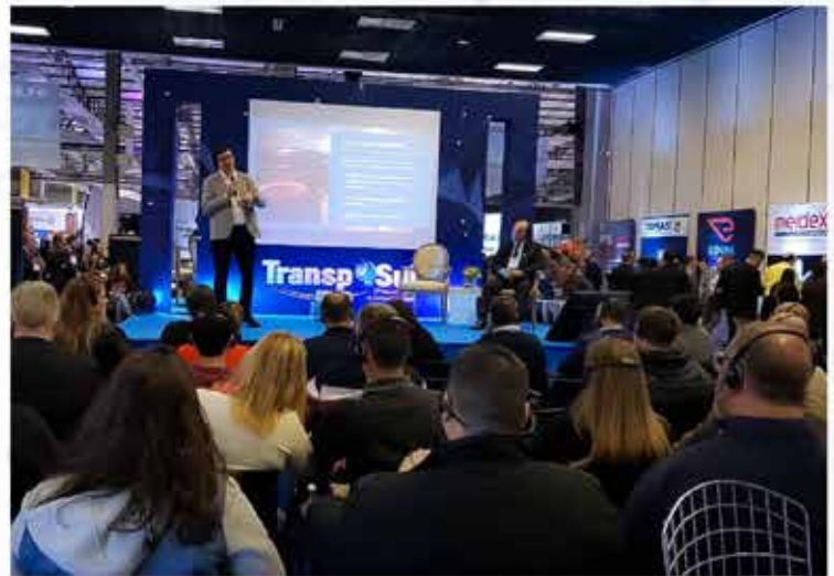
Foto: equipe Apisul na feira

Completando 35 anos de história, o Grupo Apisul se prepara para participar da 22ª edição do congresso, que dentre muitas novidades, traz a FIERGS, em Porto Alegre, como o novo espaço escolhido para sua realização