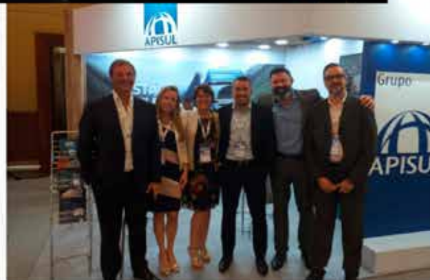
Foto: equipe Apisul na feira